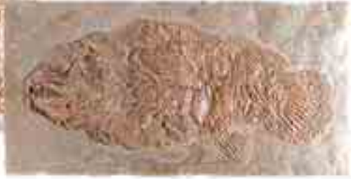
Günümüz çamur balığı

Dönem: Senozoik zaman, Eosen dönemi Yaş: 54 - 37 milyon yıl Bölge: Messel Shales Oluşumu, Almanya