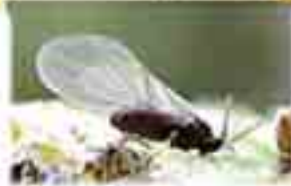
Günümüz yaprak biti

Dönem: Senozoik zaman, Eosen dönemi Yaş: 50 milyon yıl Bölge: Polonya