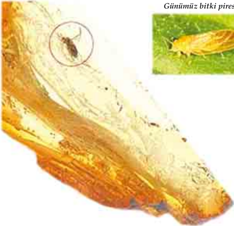
Günümüz bitki piresi