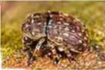
Günümüz geniş hortumlu böceği

Dönem: Senozoik zaman, Eosen dönemi Yaş: 45 milyon yıl Bölge: Rusya